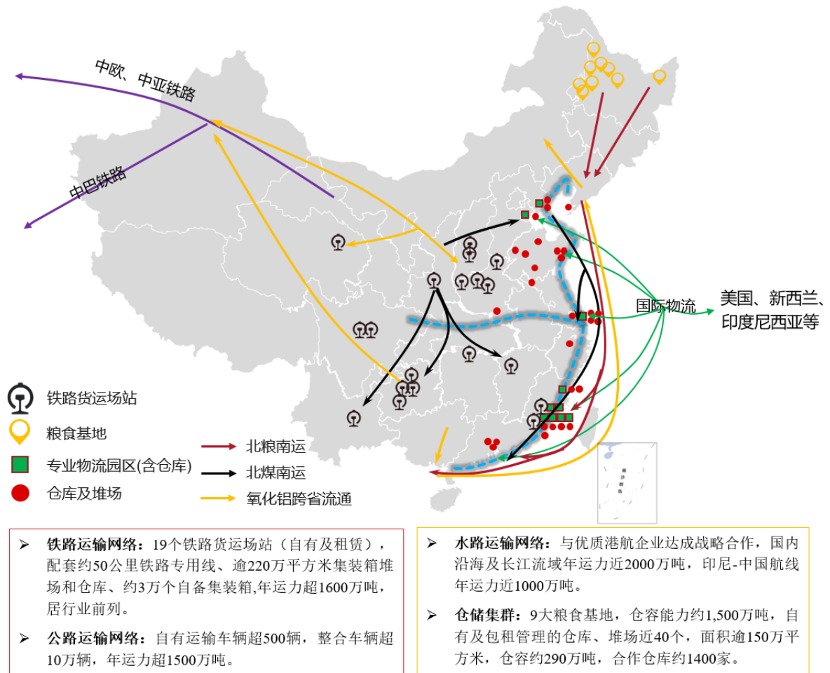
图 3：覆盖全国、连接海外的网络化物流服务体系