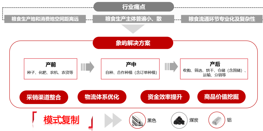
图 1：粮食全产业链服务模式

以服务粮食产业链为例，公司已形成集种肥服务、农业种植、粮食收储、物流运输、原粮供应、粮食加工及农业金融等于一体的服务布局，实现粮食全产业链一体化服务体系。在产前，公司为农业生产提供种子、化肥、农机、农资等配套服务；在产中，形成“自种+合作种植”双轮驱动的种植业务模式，并进一步探索“产业联盟订单”模式；在产后，依托9大粮食收购、仓储、物流基地和北粮南运物流服务体系，提供粮食收购、筛选、烘干、仓储、运输等服务，为温氏、双胞胎、海大、益海嘉里等大型养殖、饲料和深加工企业提供一体化原粮供应服务。